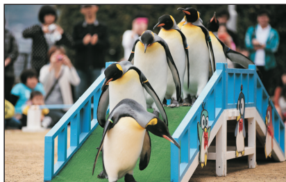
長崎企鵝水族館(長崎，日本)