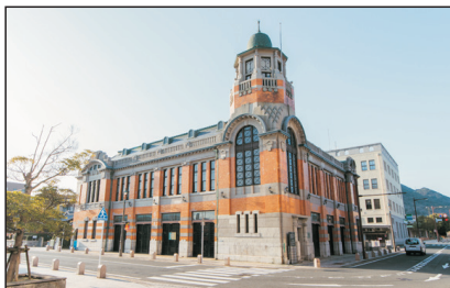
門司港(北九州，日本)